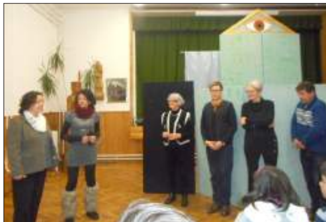
Megemlékezés Szent Mártonról