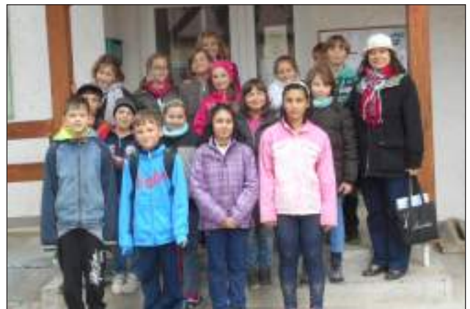
Az Önkormányzati Hivatal előtt