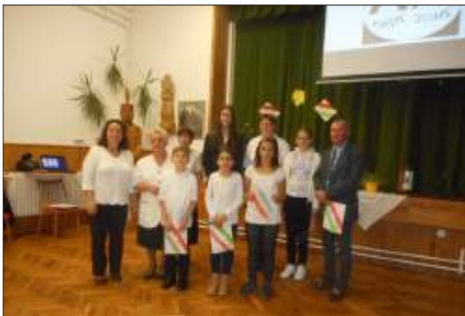
Okt. 23-án a Nemzeti ünnepen szereplők közössége