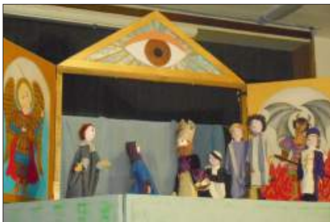
Bábelőadás Szent Márton életéről