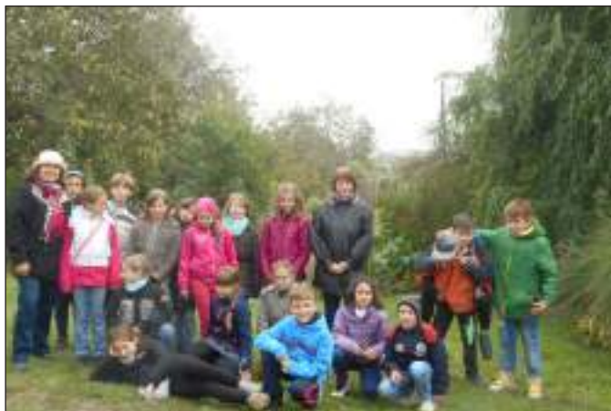
4.B. osztálydélutánja Simonyiban, a jó levegőn!