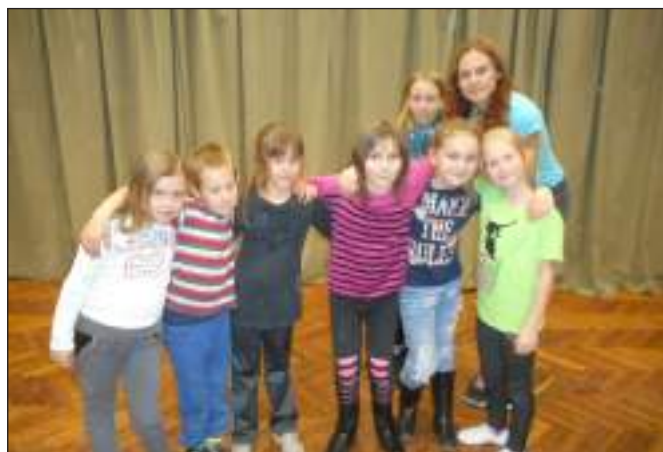
A tánctanfolyam tagjai