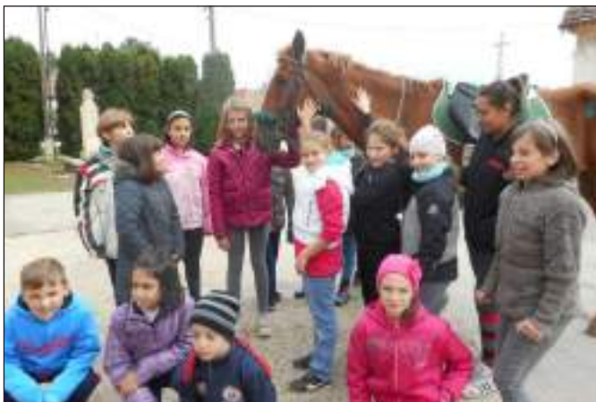
4. B. osztálydélutánja a faluban