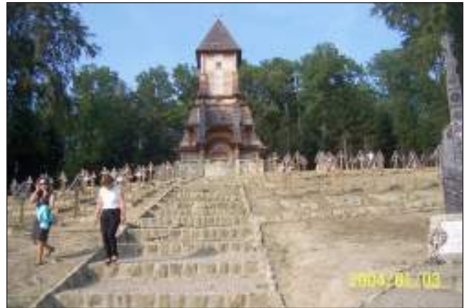
A luzsnai temető 29 méteres fakápolnája

„Életükben hadilábon, haláluk után megbékülve, együtt nyugszanak csontjaik.”