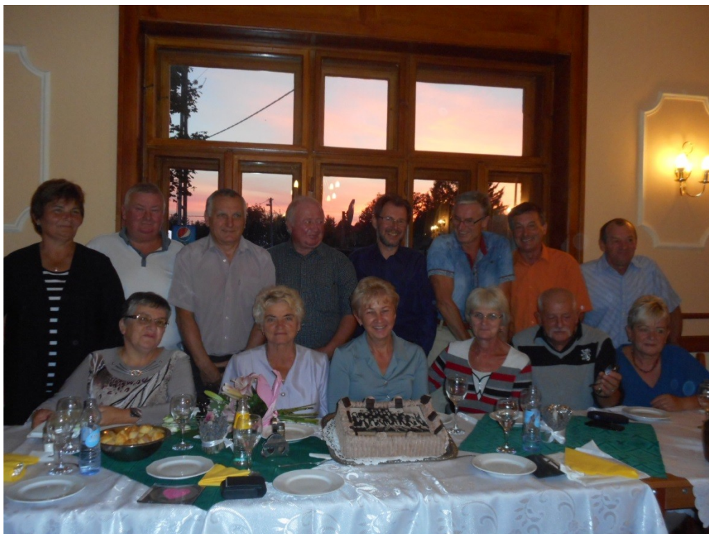
Sitkén a 45 éves osztálytalálkozó

A megjelent osztályok folytatták a közös együttlétet, beszélgetéssel, vacsorával, nosztalgizással.