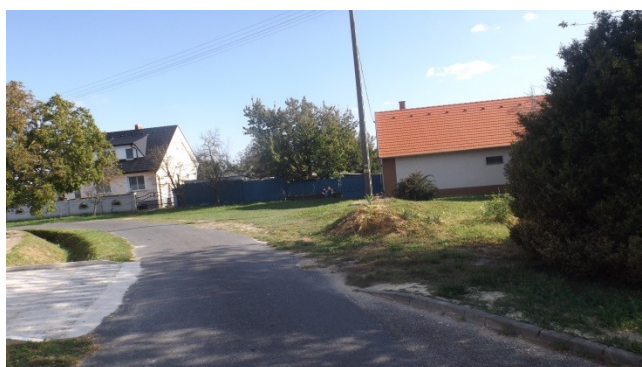
Arany János utca és a Rákóczi utcasarok