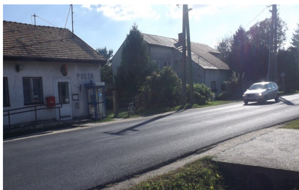
Mai Kossuth Lajos utca