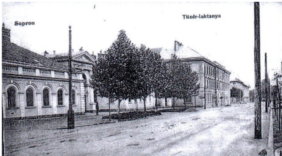
Az utcai épület kis része a bombázás után

Ma már csak a bombázás utáni rész maradványai találhatók, lakásokat alakítottak ki belőle, a laktanya nagyobb részén vállalkozások telepedtek le. Nagyon keserűen emlékezett azon időkre, amikor az eget lesve számolták a következő bombák helyét, futottak össze-vissza legjobb katona társával, a halál elől, a laktanya területén. Teljes elkeseredésében, kimerülésében, mondta a barátja, hogy nem bírja tovább a figyelmet, ha meg kell halni, itt halunk meg, „nem-nem gyere” nem ment és eltalálta a bomba, ennyi év után is megkönnyezte hősi halottját . Édesanyja egyetlen fiát, a túlélő barátja. Csak temettek, szörnyű volt, ennyit mondott.