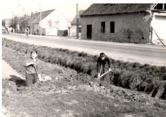
Régi utcarészlet – a kép 1970-ben készült, amikor a vízvezeték árkot ásták