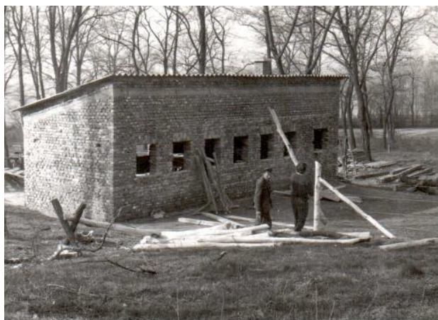
Régi Lőtér – sajnos ma már ez nem látható