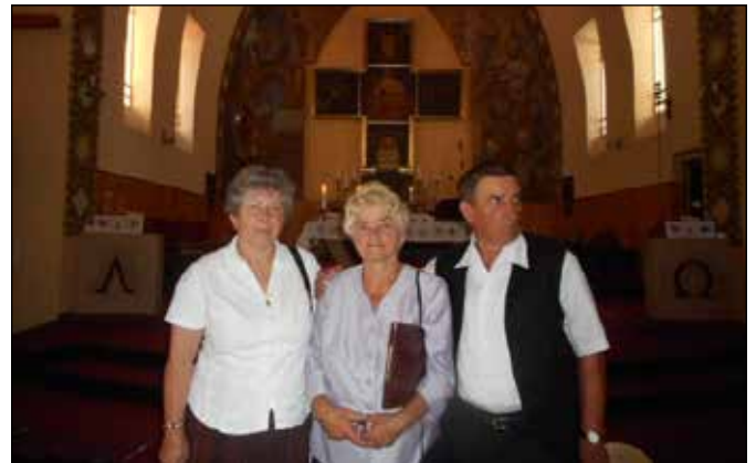
A Kelenvölgyi templomban

A MAGYARSÁG ÚTJA kapujának megáldása és ünnepélyes avatása a templomkertben. Közreműködtek: