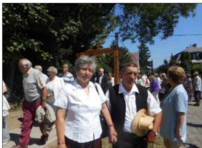
A boldog házaspár