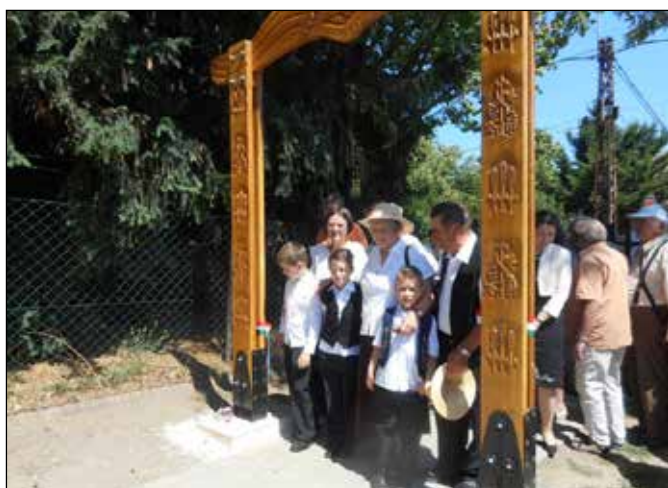
Séta a Magyarság útja kapun keresztül