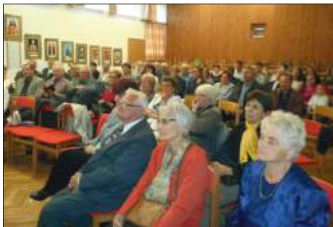
Az ünneplő közönség