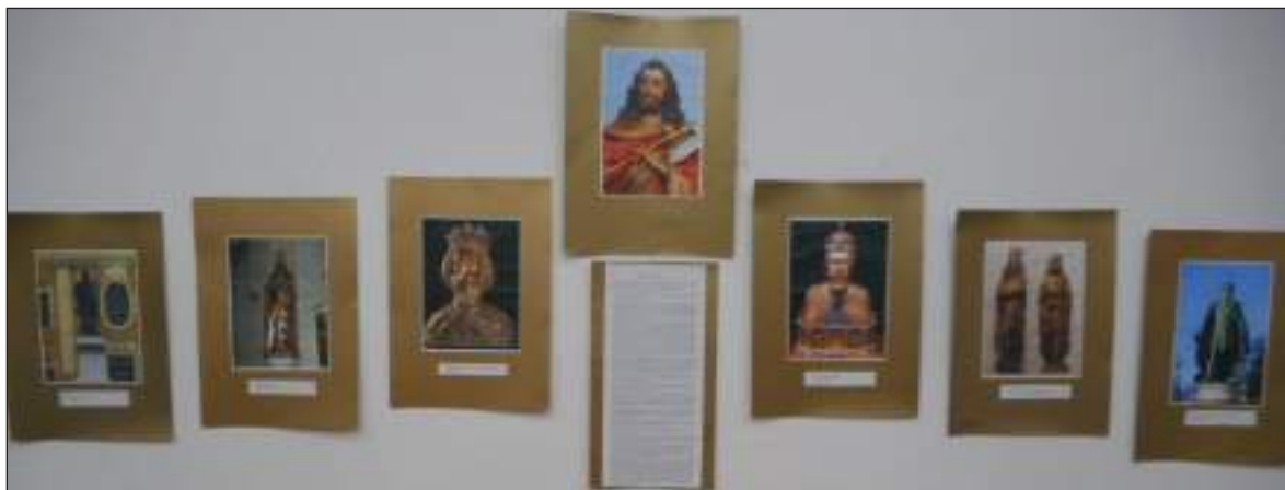
Szent László kiállítás képei