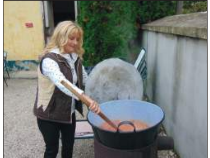
Készül a gulyás