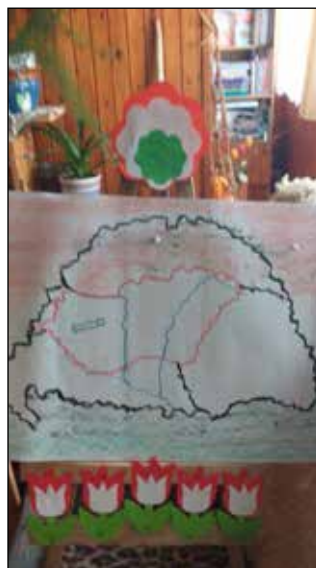
Lábos Mária ny.tanárnő készítette.