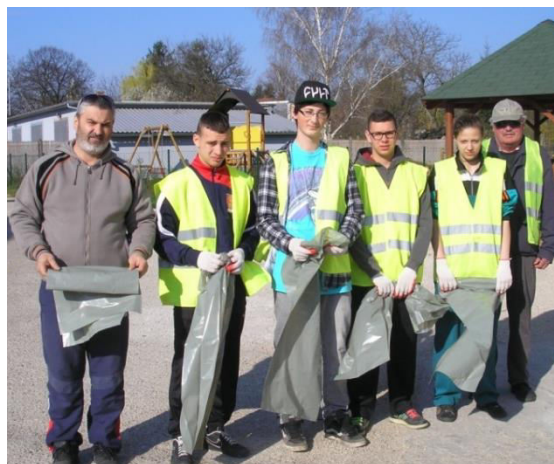
Szemégyűjtés a faluban

- Tisztelt Nagysimonyiak! Környezetünk tisztán- és rendben tartása közös ügyünk, ezért kérünk mindenkit, hogy ilyenkor tavasz tájt évente legalább egy alkalommal az ingatlanjukra bevezető hidak, átérsek állapotát ellenőrizzék és az odatartozó árokszakasszal együtt takarítsák!