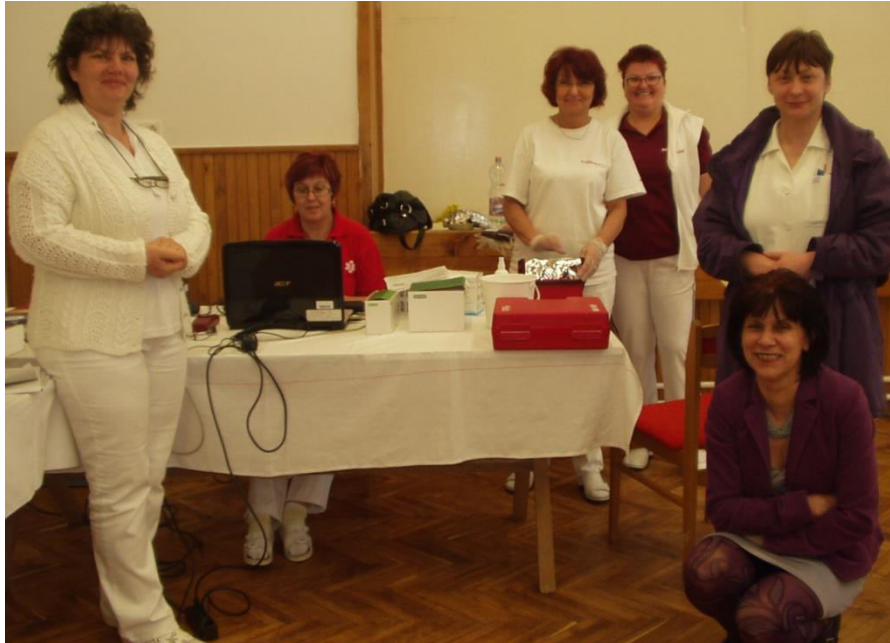
A Celldömölki Kemenesaljai Egyesített Kórház Vérellátó Központ orvosa és aktivistái Nagysimonyiban

Köszönet a Celldömölki Kemenesaljai Egyesített Kórház Vérellátó Központ Orvosainak és Dolgozóinak valamint a Magyar Vöröskereszt Celldömölki Szervezete Vezetőinek a sok évtizedes véradást szervező és lebonyolító munkájáért!