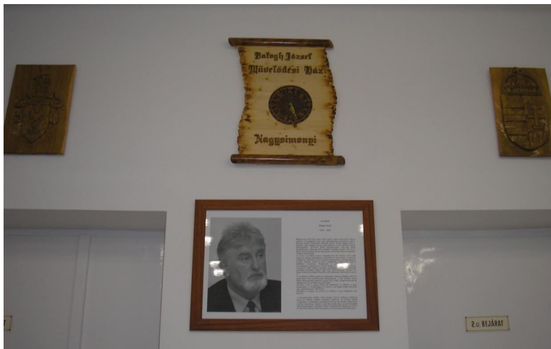
Az előtérben a Névadó: Balogh József költő-tanár képe és életrajza