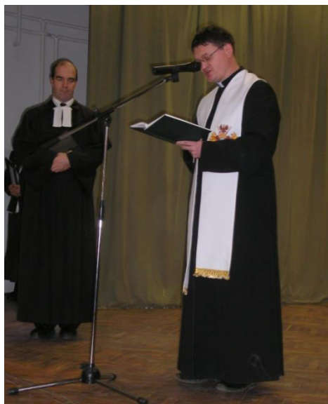
A Művelődési Ház megáldása az Egyházak részéről