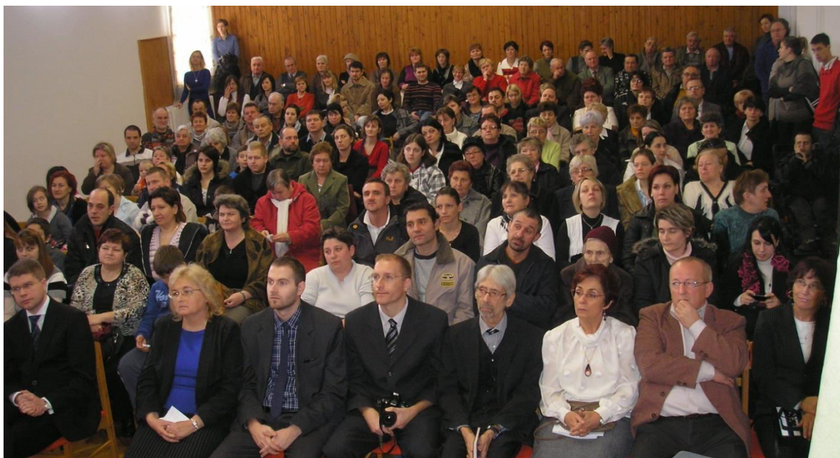
A teltházas Művelődési Ház a névadó ünnepségen