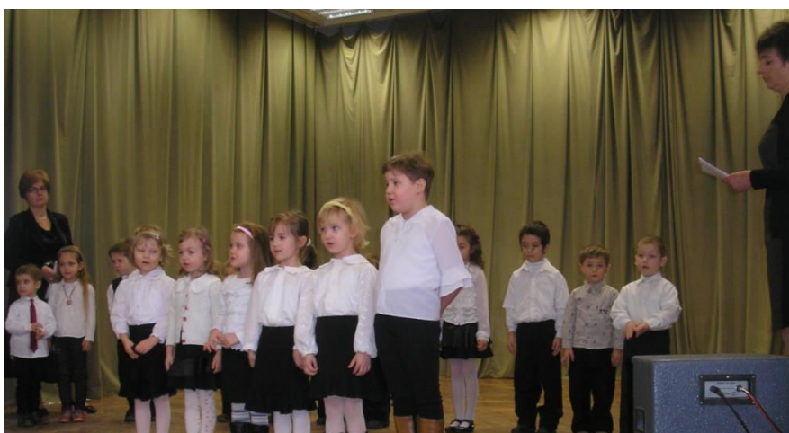
A helyi óvodások műsora