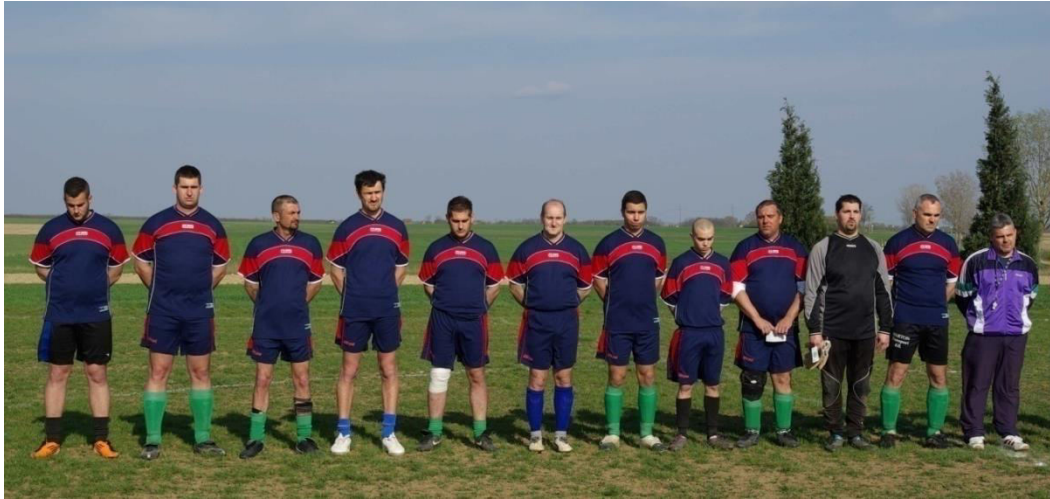
A férfi csapatok a székyel illetve a magyar himnusz hallgatása közben.