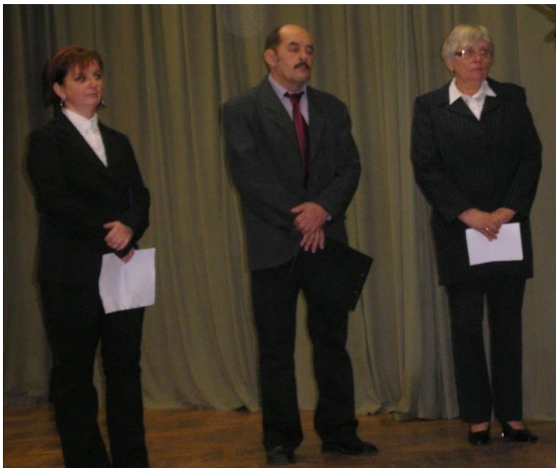
Az irodalmi műsor felnőtt szereplői