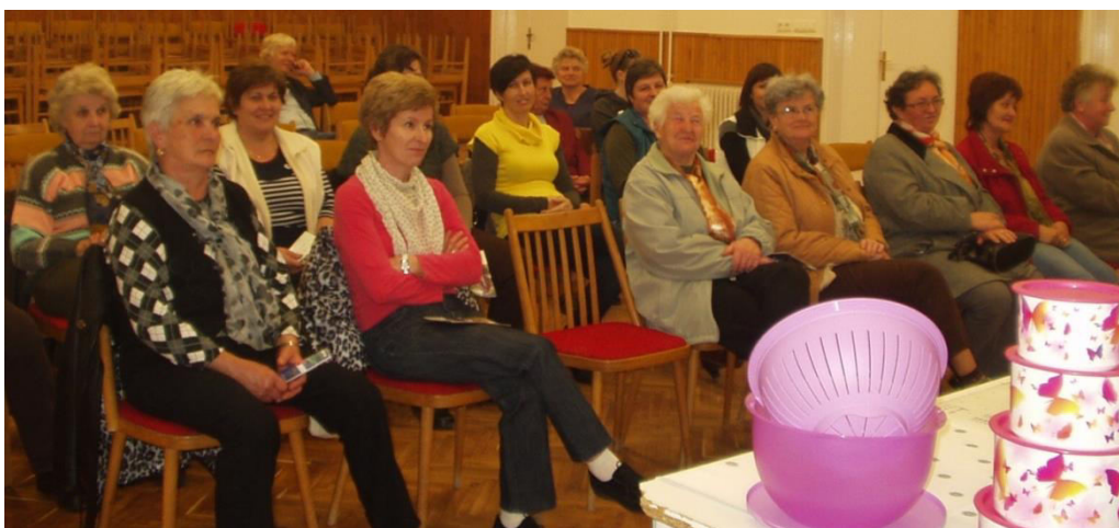
„Az 1 éves születésnapot” tortával ünnepelték