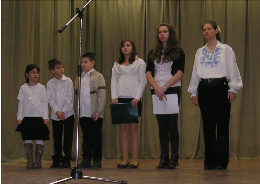
Az irodalmi műsor gyerek szereplői