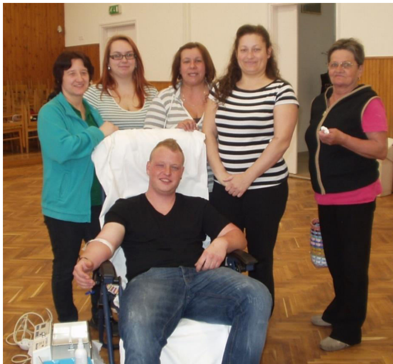
Nagysimonyi Véradók márc. 20-án