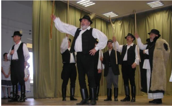
Nicki néptáncgyűttes „Fereteges” műsora