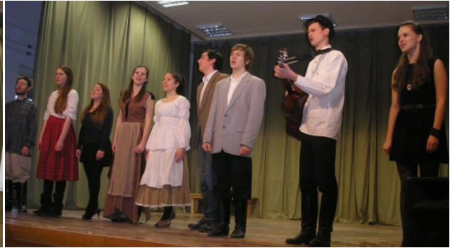
Soltis Színház előadása